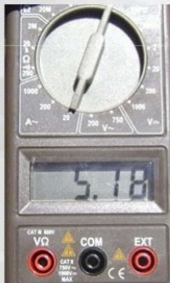
Sin Energy Pack

Disminuye el consumo de amperes hasta en un 50% en el motor en el que se instala, y por lo tanto disminuyendo la facturación eléctrica de los equipos de mayor consumo.