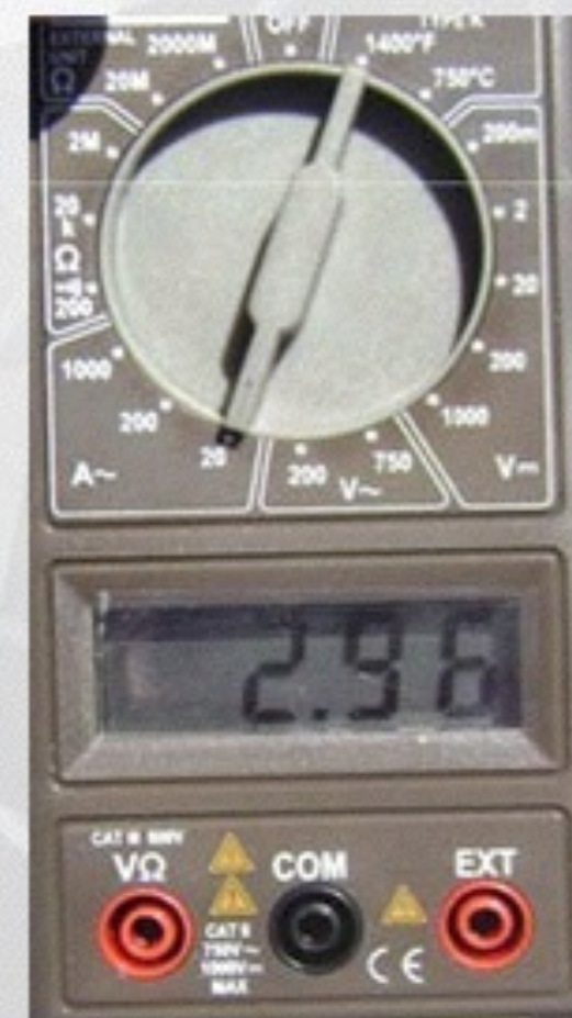
Con Energy Pack